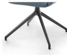
1016 Spinnenfuß drehbar schw. matt strukt. (gegen Aufpreis)