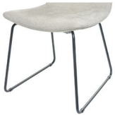
1095 Metallgestell schwarz matt Standard