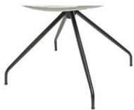
991 Spinnenfuß drehbar schwarz matt (gegen Aufpreis)