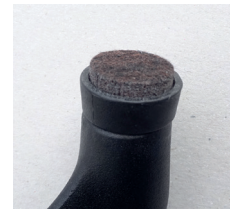
Filzgleiter (gegen Aufpreis)