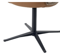
1071 Viersternfuß drehbar schwarz matt (gegen Aufpreis)