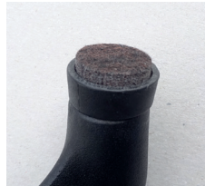
Filzgleiter (gegen Aufpreis)