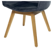
1096 Holzgestell Eiche geölt (gegen Aufpreis)