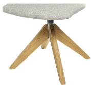
1098 Spinnenholzfuß drehbar Eiche geölt (gegen Aufpreis)