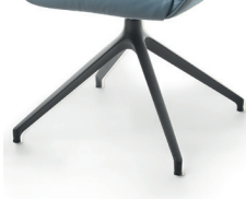
1099 Spinnenfuß drehbar schwarz matt (gegen Aufpreis)