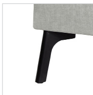
Chrom Nr. 711 Schwarz Nr. 712