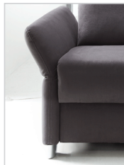
Armlehne Typ 2