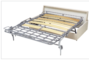
Ergoflex Lattenrost Standard