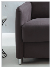
Armlehne Typ 1