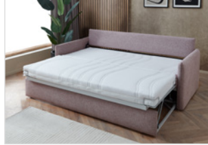
AL Typ 2