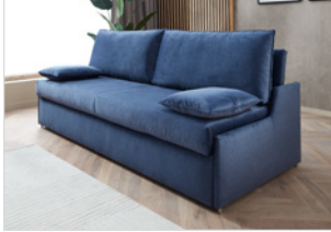
AL 1 incl. Seitenkissen