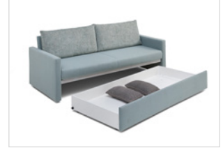
Einzellege mit Bettkasten