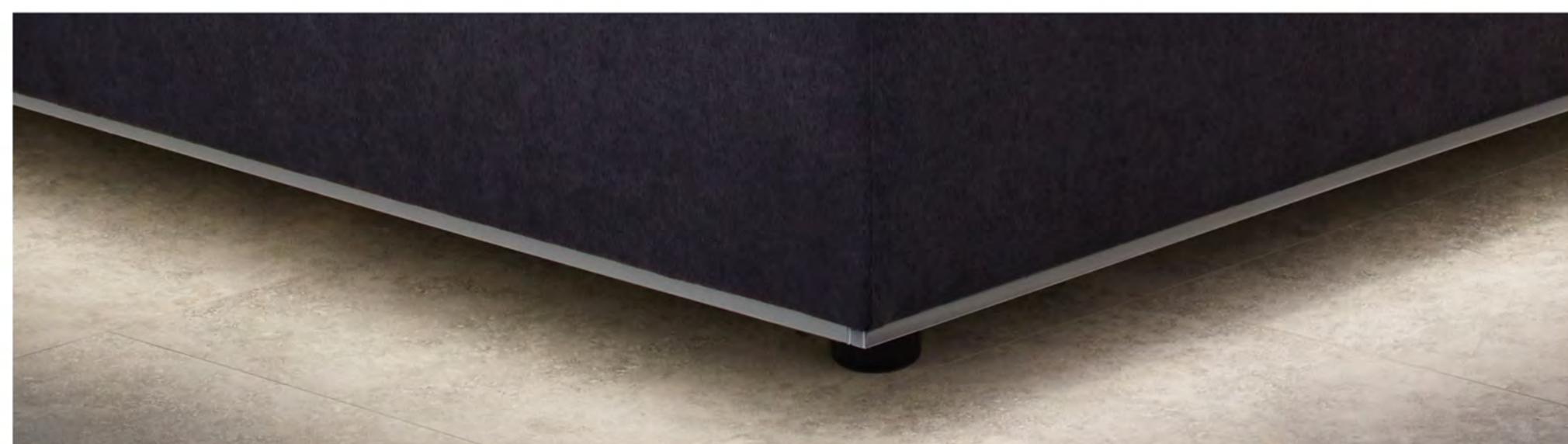
Unterbodenbeleuchtung optional erhältlich