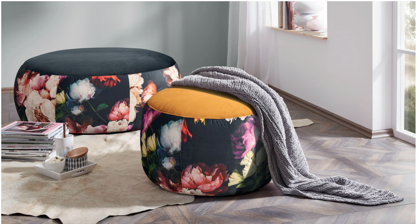
Hocker rund (Ø 105 cm) - Hocker rund (Ø 60 cm)