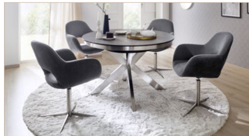
Kreuzfußstuhl MELROSE mit Tisch WINNIPEG