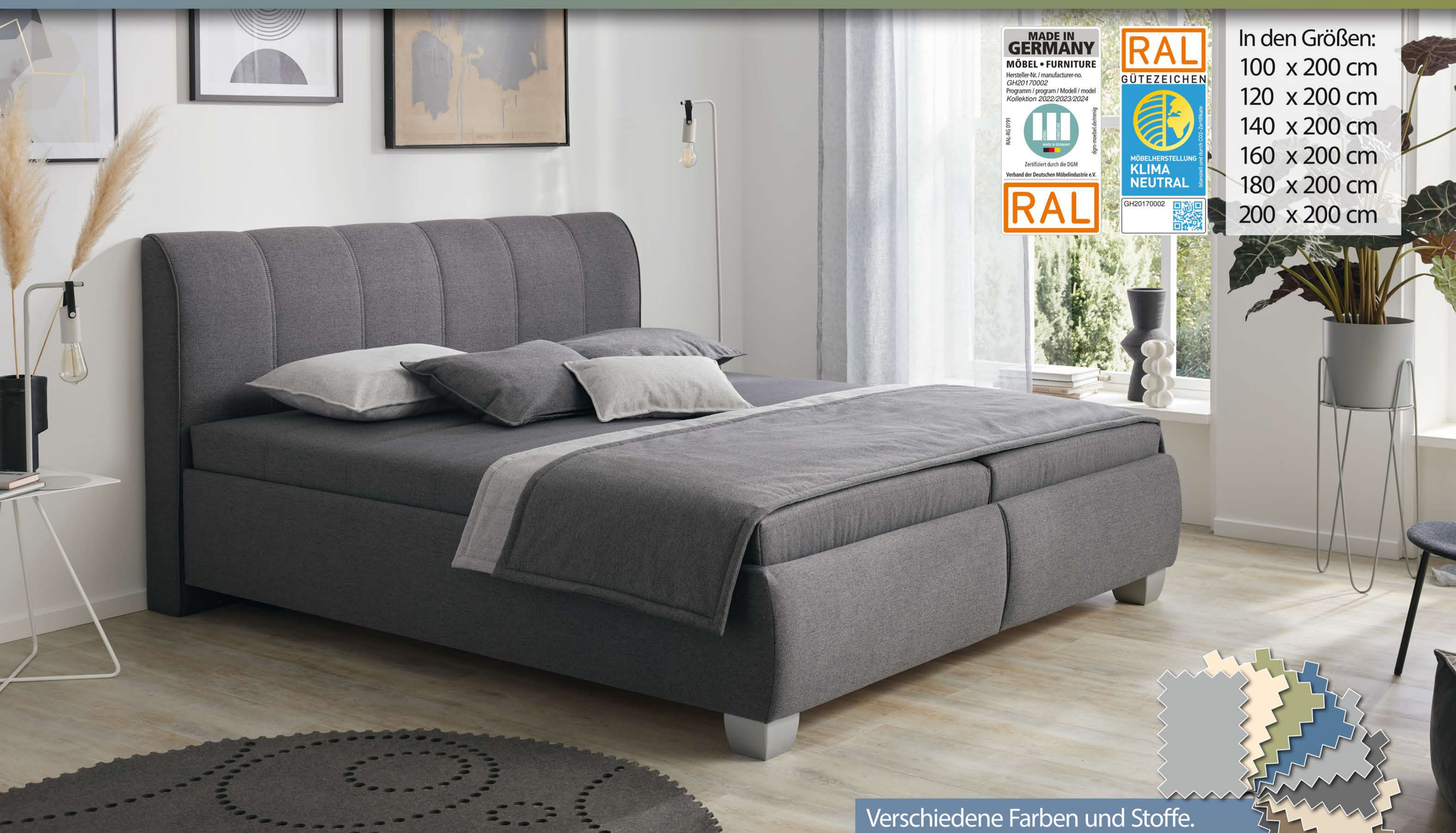
Verschiedene Farben und Stoffe.