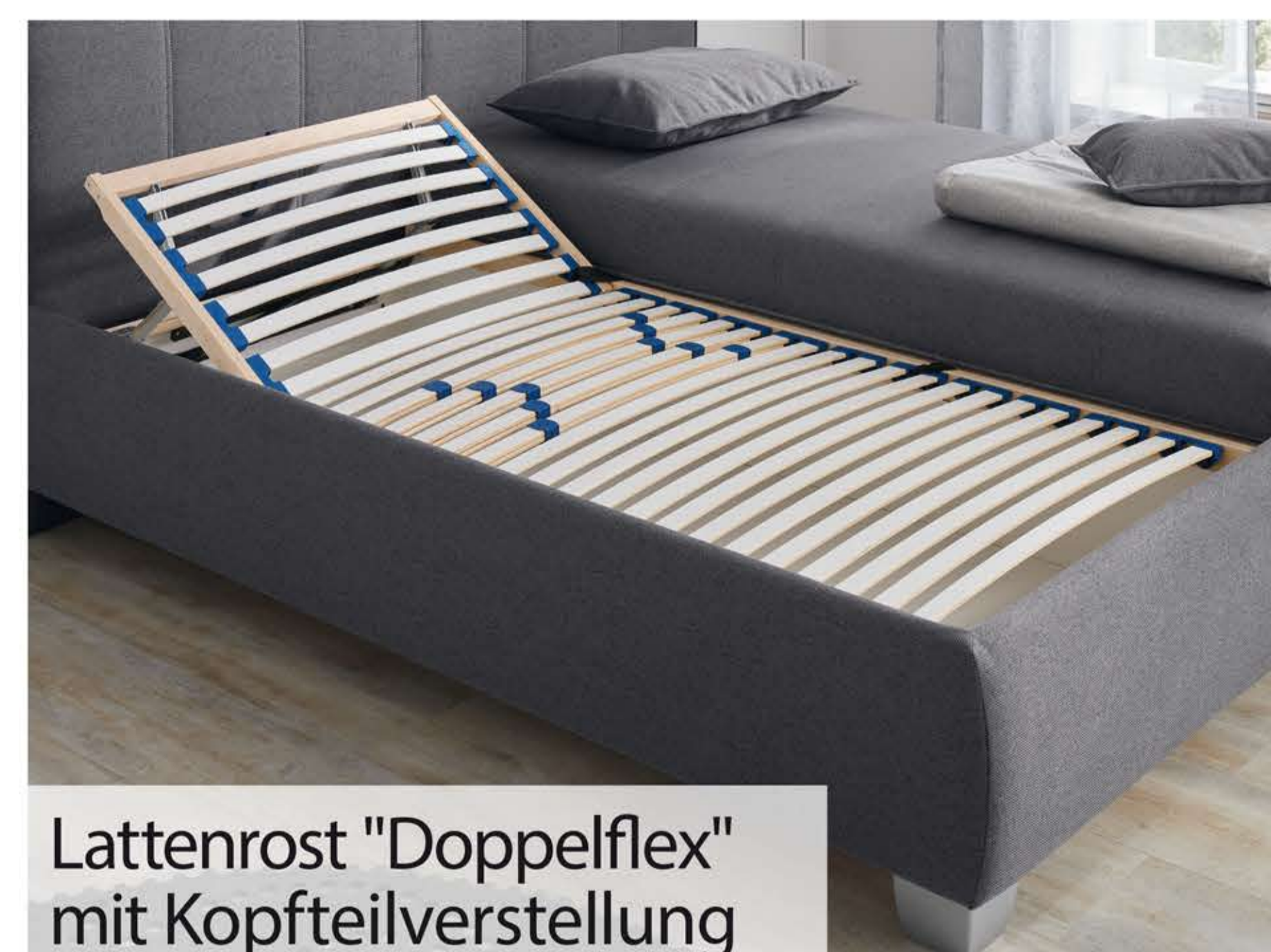
Lattenrost "Doppelflex" mit Kopfteilverstellung