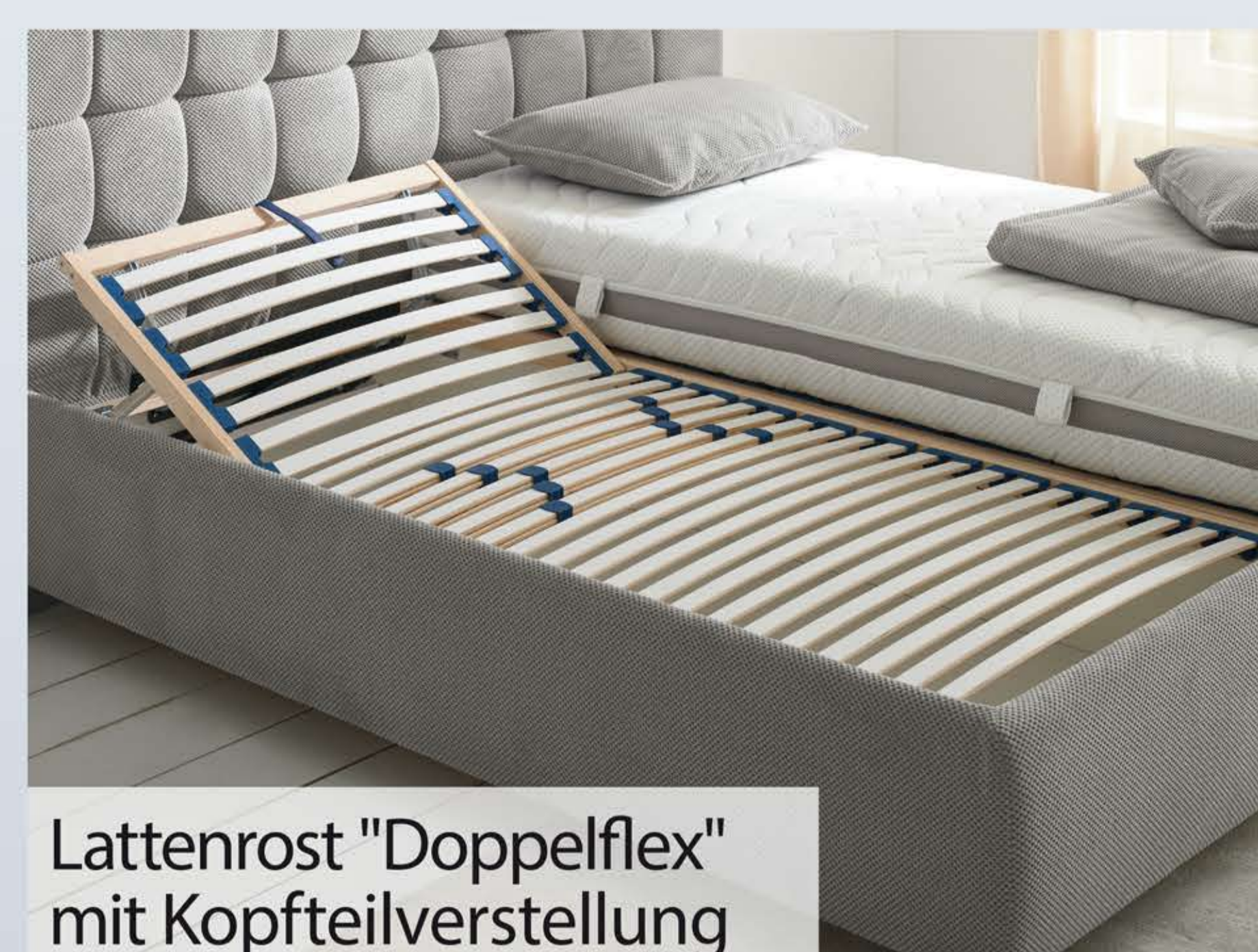
Lattenrost "Doppelflex" mit Kopfteilverstellung