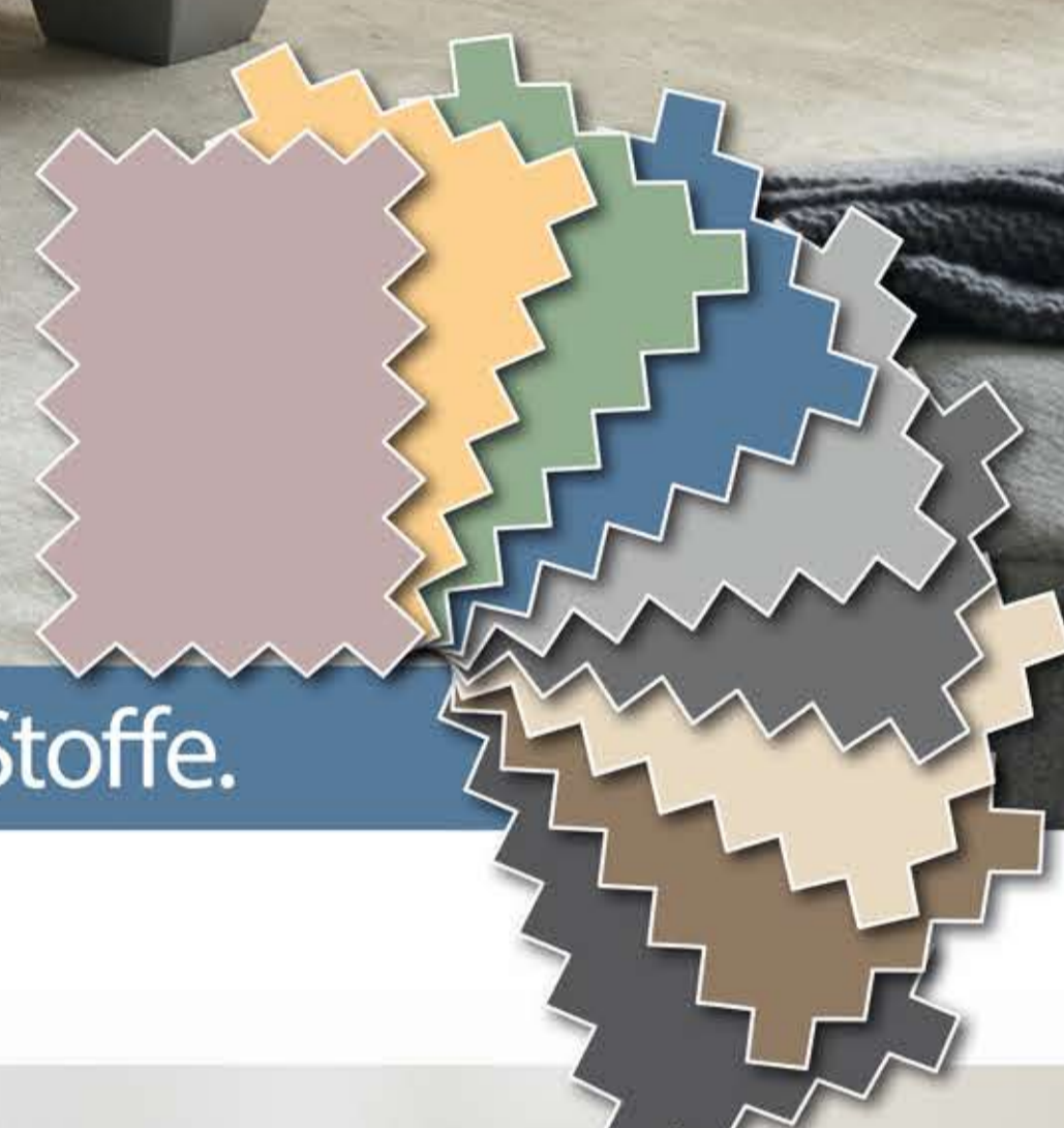
Verschiedene Farben und Stoffe.

Wendematratze mit 2 Härtegraden (In der Kombi H2/H3 und H3/H4 erhältlich)