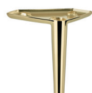
328 Metallfuß gold glänzend