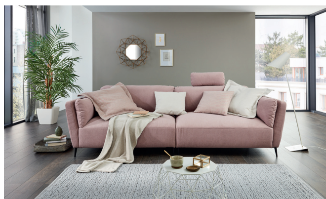
Maxisofa mit 2 Armlehnen