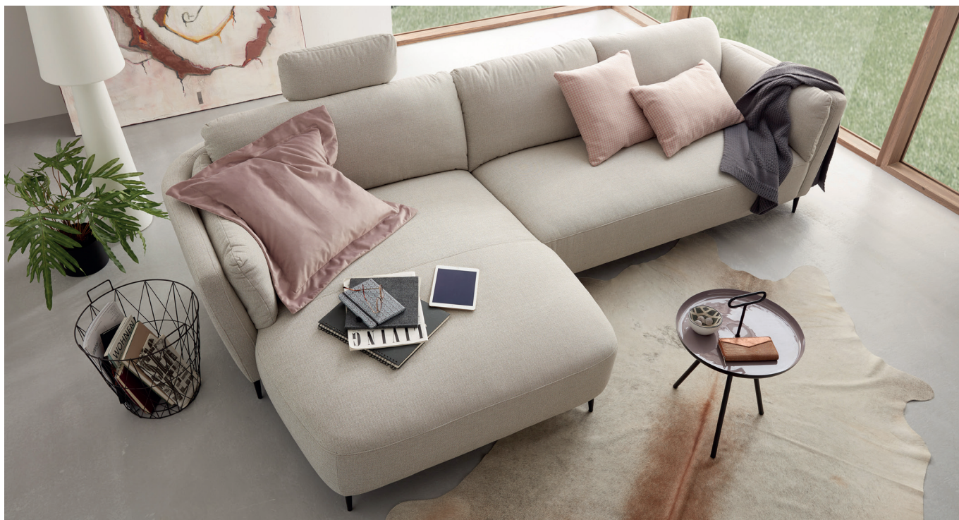
Longchair mit Armlehne links - 3-Sitzer mit Armlehne rechts