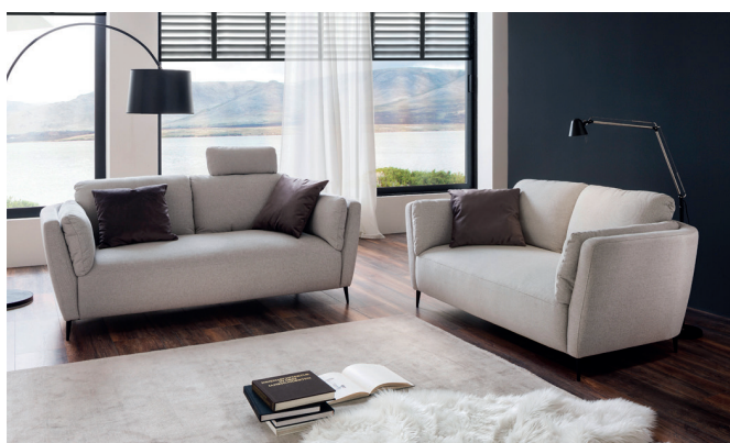
3-Sitzer mit 2 Armlehnen + 2,5-Sitzer mit 2 Armlehnen