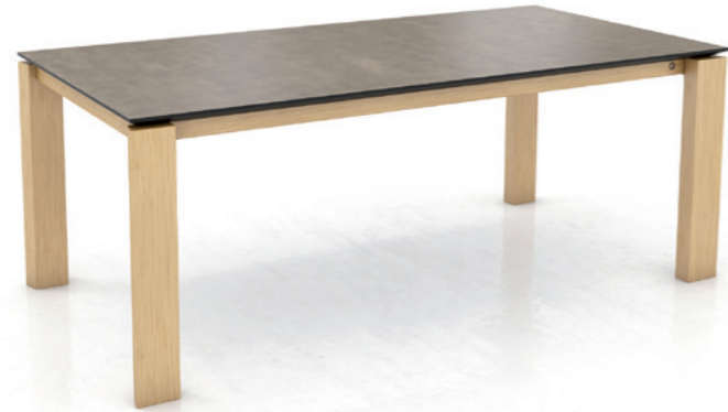
OXFORD PB1 - without extension