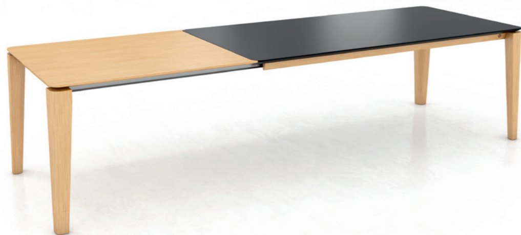
OXFORD PB2 - with extension