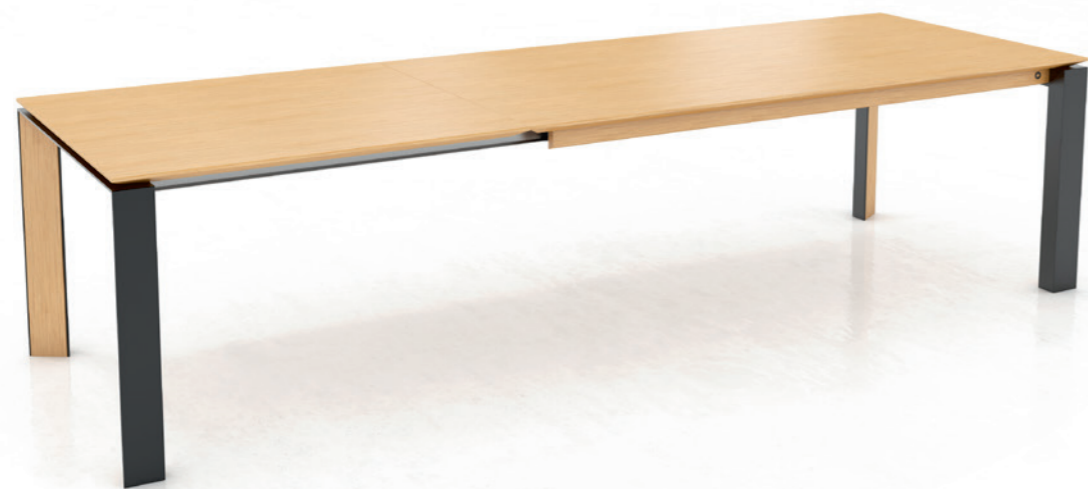
OXFORD PB3 - with extension