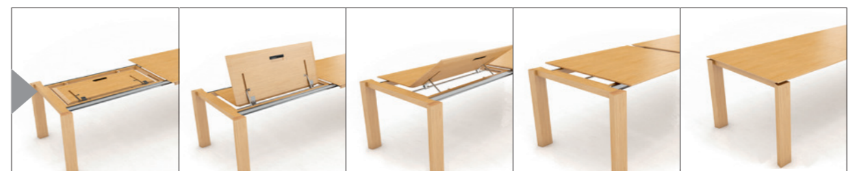
Aluminium Gestellauszug mit flachem Butterfly-System für Massivholzverlängerung Aluminium mechanism for solid wood butterfly extension