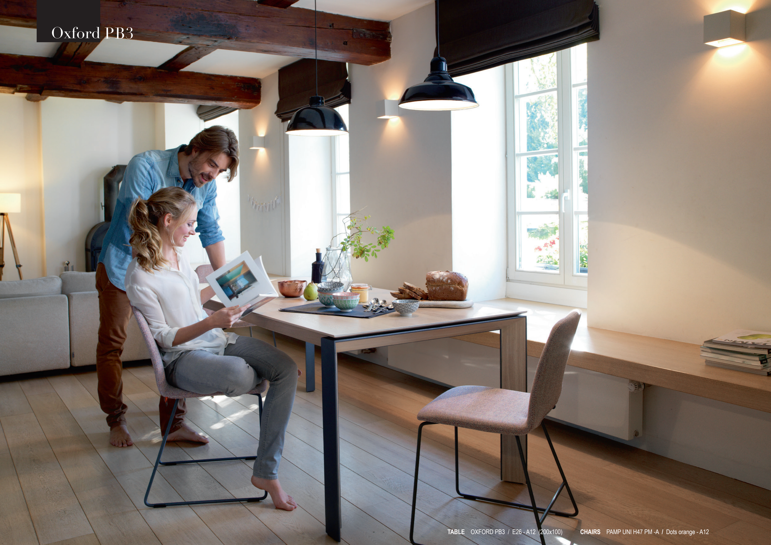
TABLE OXFORD PB3 / E26 - A12 (200x100)

CHAIRS PAMP UNI H47 PM - A / Dots orange - A12