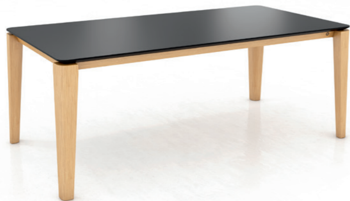
OXFORD PB2 - without extension