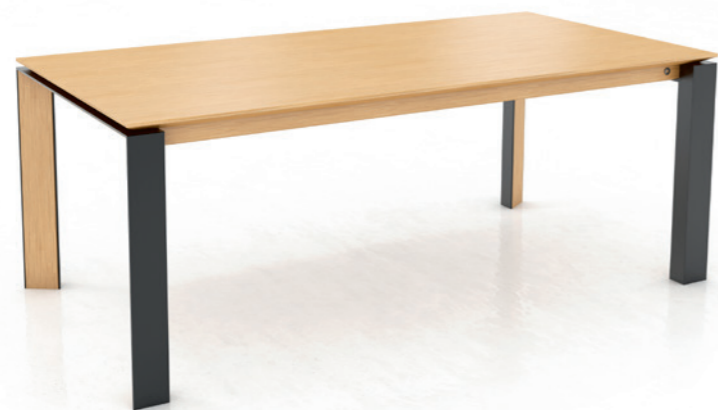
OXFORD PB3 - without extension