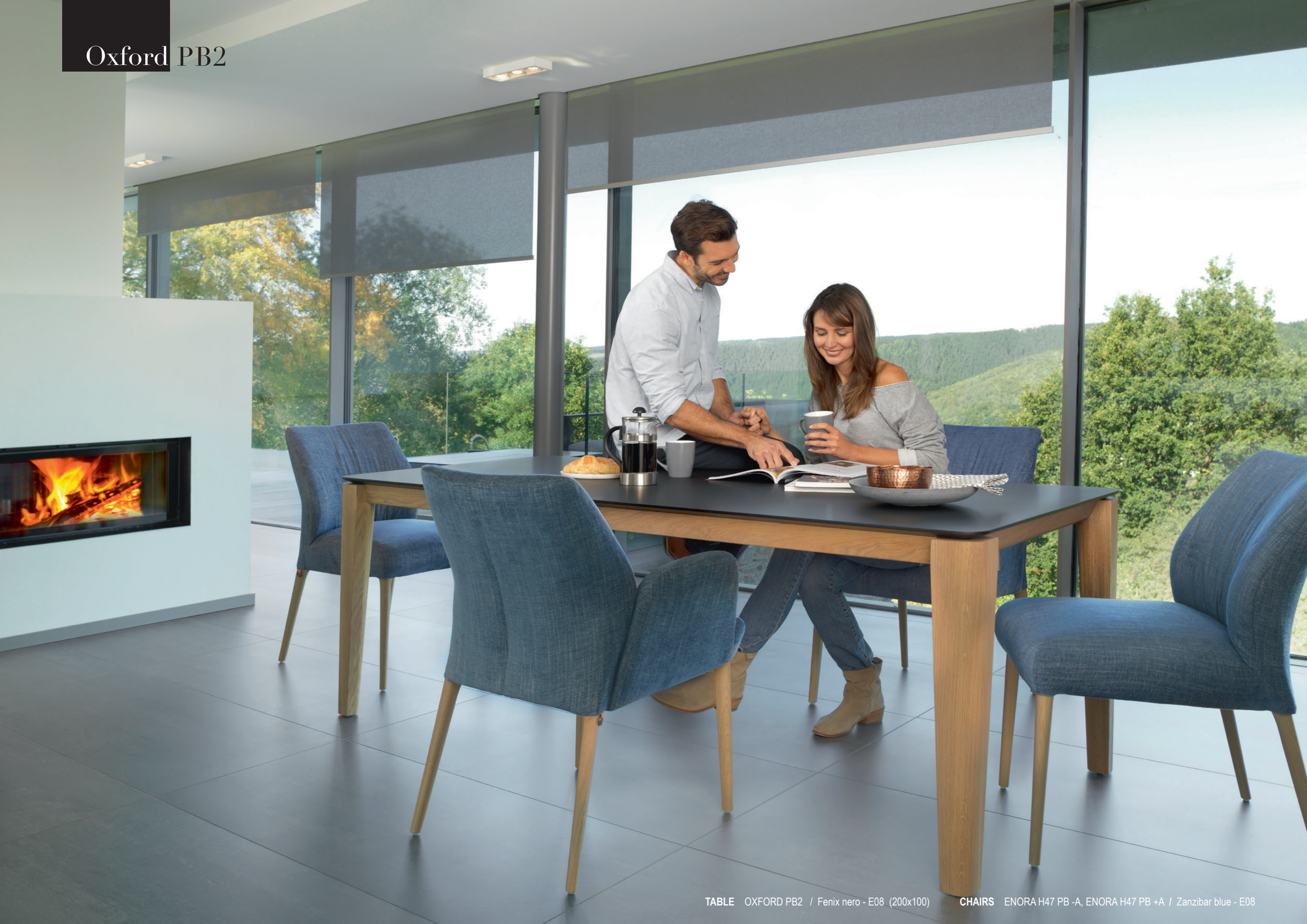
TABLE OXFORD PB2 / Fenix nero - E08 (200x100)

CHAIRS ENORA H47 PB -A, ENORA H47 PB +A / Zanzibar blue - E08