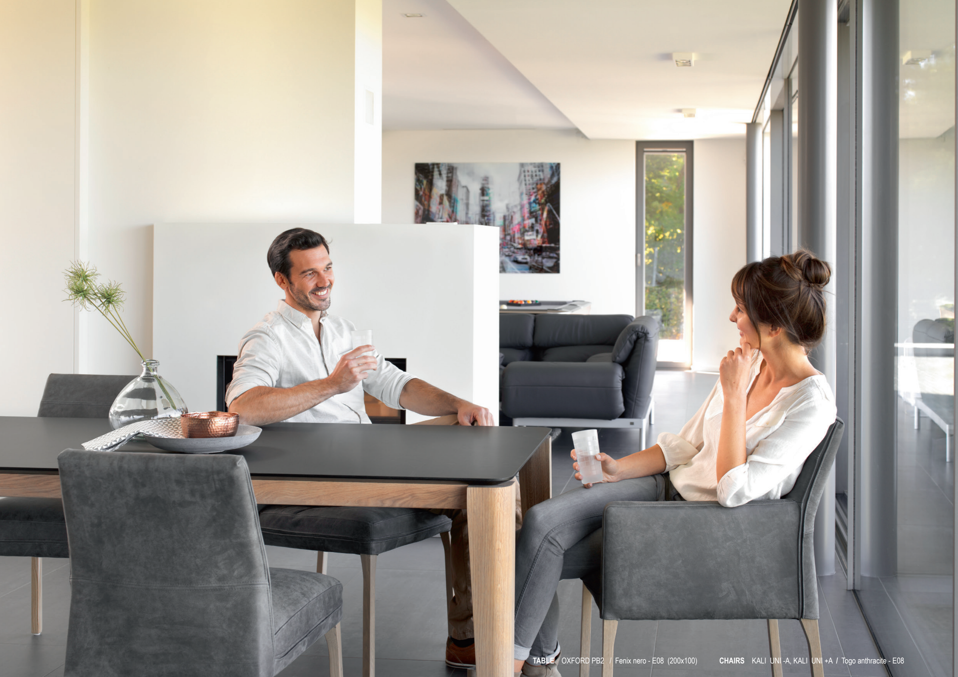
TABLE OXFORD PB2 / Fenix nero - E08 (200x100)

CHAIRS KALI UNI -A, KALI UNI +A / Togo anthracite - E08