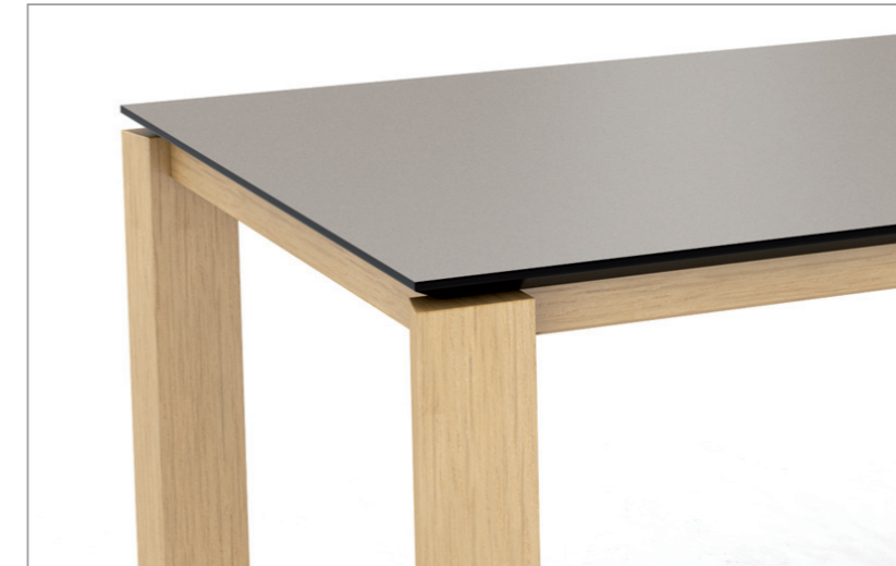
Unabhängig von der gewählten Farbe der Plattenoberfläche ist die Kante immer schwarz. Irrespective of the colour of the top chosen, the field is always black.