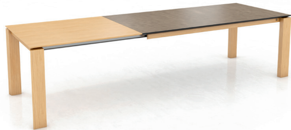
OXFORD PB1 - with extension