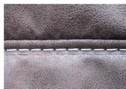
Kappnaht mit Kontrastfaden beige