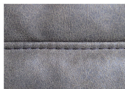
Kappnaht ohne Kontrastfaden