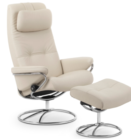
Hoher Rücken/ Original Untergestelle