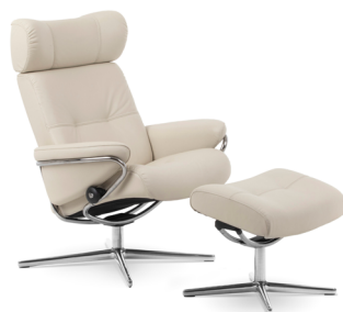
Verstellbare Kopfstütze Cross Untergestelle