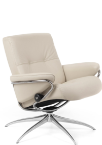
Niedriger Rücken/ Star Untergestelle