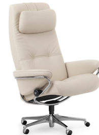
Hoher Rücken/ Home Office Untergestelle