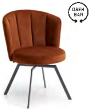
2132-Elina: BHT 62/83/64 cm