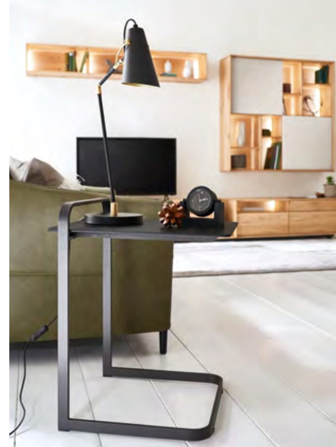
Beistelltisch 4004-1833L: LBH 50/40/56 cm • Metall anthrazit matt, Keramik basalto